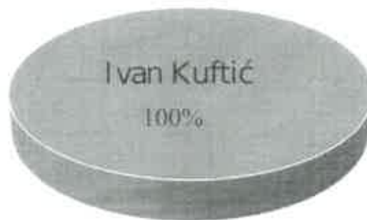
Vlasnička struktura prije i nakon mjera restrukturiranja

Tvrtka DOMUS AUREA ISTRA d.o.o. je u 100%-tnom privatnom vlasništvu, a vlasnik je IVAN KUFTIĆ. Nakon restrukturiranja vlasnička struktura tvrtke neće se mijenjati. U nastavku se nalazi grafički prikaz vlasničke strukture prije i nakon mjera restrukturiranja.