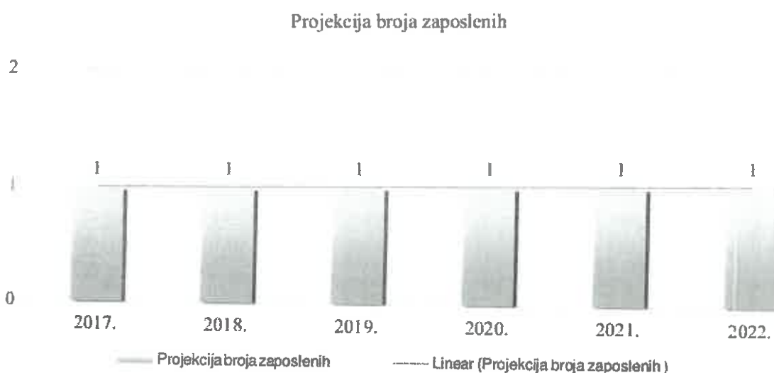
Grafički prikaz Plan kretanja broja zaposlenih po godinama

Planirano kretanje broja zaposlenih prikazano je grafičkim prikazom u nastavku, a odnosi se na period od 2017. g. - 2022. g. Grafički prikaz prikazuje povećanje broja zaposlenih u odnosu na prethodne godine (prosječan broj zaposlenih) što je rezultat restrukturiranja tvrtke i povećanja prodaje do kojeg se došlo kroz projekciju budućeg poslovanja tvrtke.